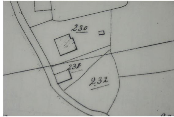
Situatie in 1821 met B0231