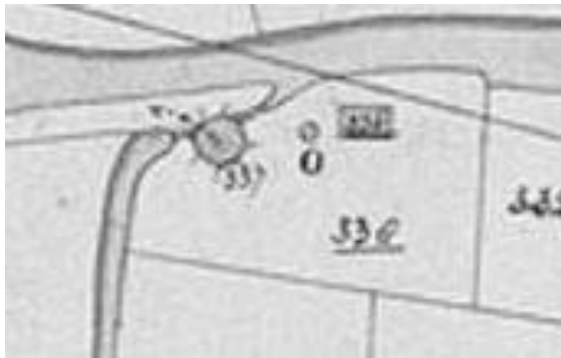
Situatie in 1821