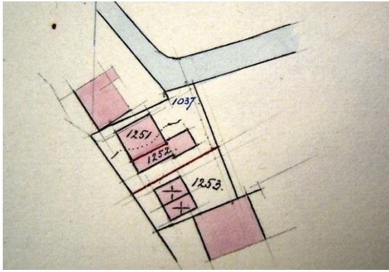
1917 splitsing waarbij A1253 ontstaat