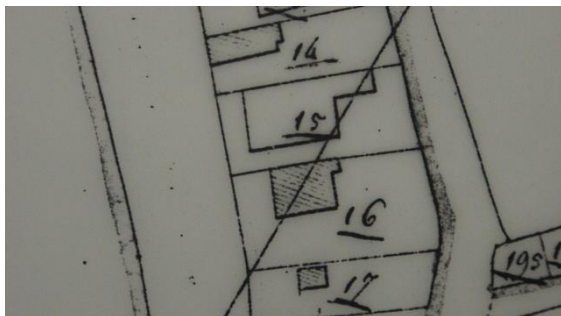
Situatie in 1821 met A0016