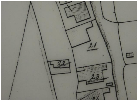
Situatie in 1821 met A0022