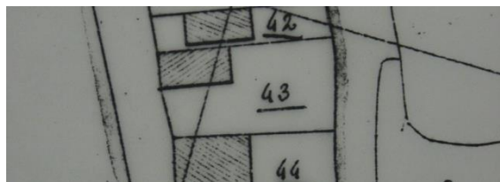
Situatie in 1821 met A0043