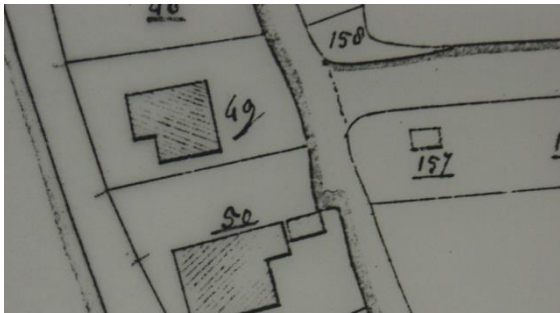
Situatie in 1821 met A0157