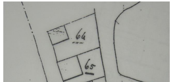
Situatie in 1821 met A0064