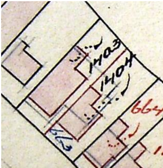
1929 sloping en stichting, 1931 splitsing