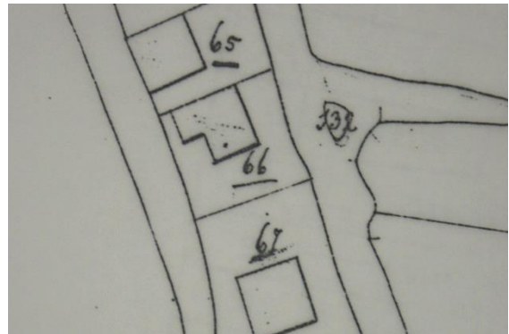
Situatie in 1821 met A0066