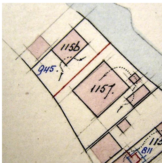
1909 splitsing. Schuur wordt huis

-deel van Kanaaldijk 131 (schuur en erf) -1909 splitsing, schuur wordt huis