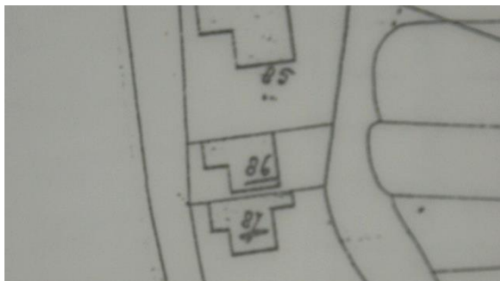
Situatie in 1821 met A0086