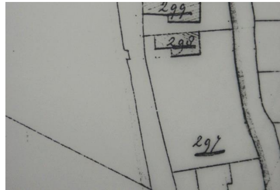
Situatie in 1821 met A0298