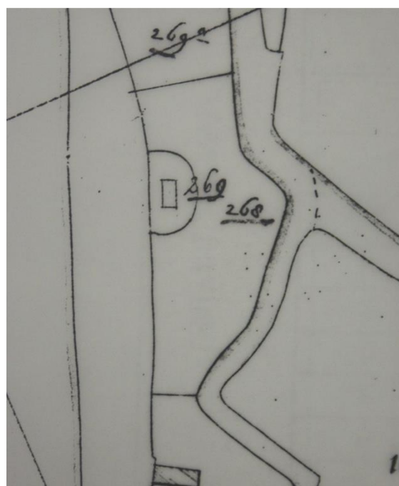
Situatie in 1821 met B0268