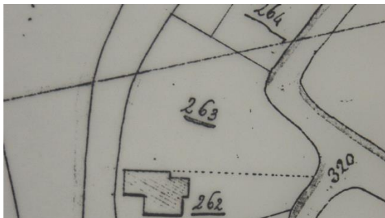
Situatie in 1821 met B0263