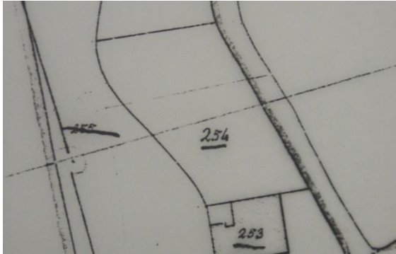
Situatie in 1821 met B0254