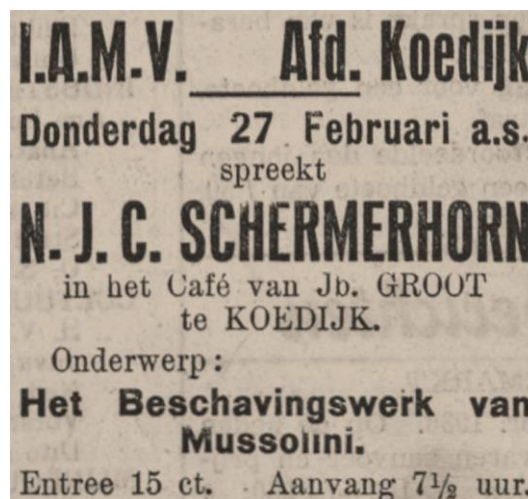
Alkmaarsche Courant 1936

De avond werd zo een groot succes. Op donderdagavond 27 februari 1936 spreekt op uitnodiging van de I.M.A.V Koedijk N.J.C Schermerhorn 2 in het café van Jb. Groot ('t Vergulde Paard). Het onderwerp is "Het Beschavingswerk van Mussolini".