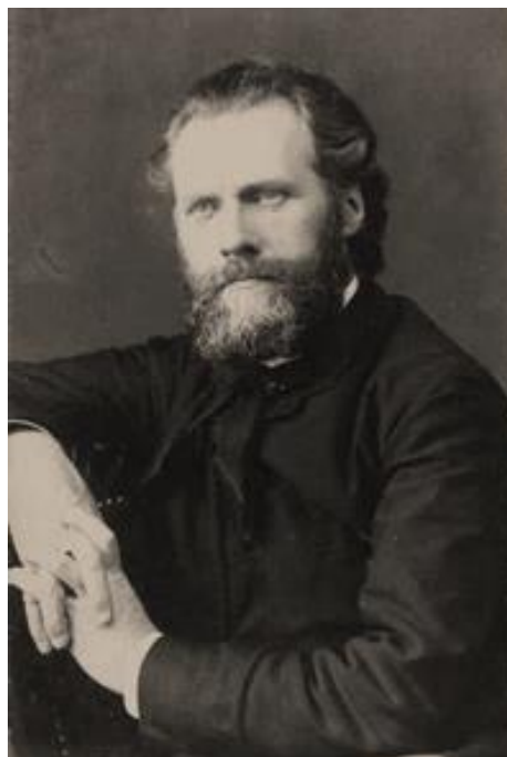
Ferdinand Domela Nieuwenhuis

In 1933 werd ook in Koedijk een afdeling van de I.A.M.V. opgericht.