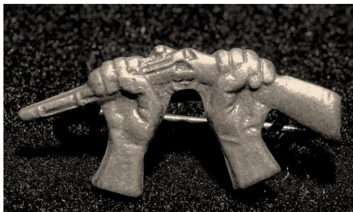
Het gebroken geweeetje, symbool van de I.A.M.V.

Op zaterdag 23 en zondag 24 juni 1934 vond een bijeenkomst plaats van de Provinciale Samenwerking op antimilitaristisch gebied in Noord-Holland. Deze bijeenkomst vond plaats op het sportterrein van Koedijk.