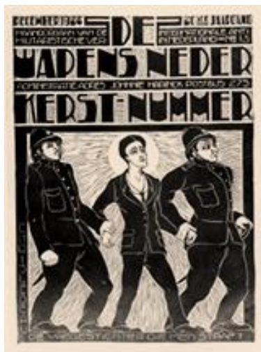
Maandblad I.A.M.V: De Wapens Neder

Aan het eind van de avond volgt nog een gedachtewisseling met het publiek: