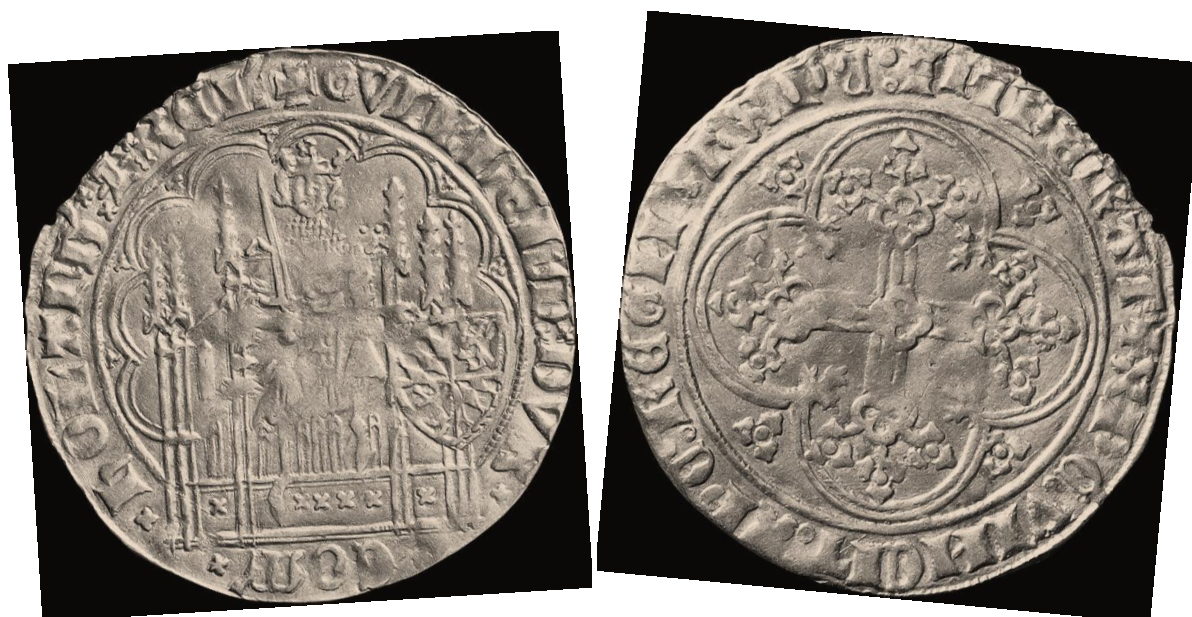
Hier een ander soort Gouden Schild, waarop nog duidelijk de afbeeldingen te zien zijn

De genoemde vorsten zijn Philips de Goede en Jacoba van Beieren, beide wel bekend in onze geschiedenis. Na het verdrag tussen deze beiden, dat bekend staat als “de Zoen van Delft” in 1428, is er gemunt op naam van Philips én van Jacoba tot 1433, toen Jacoba het verdrag verbrak door zonder