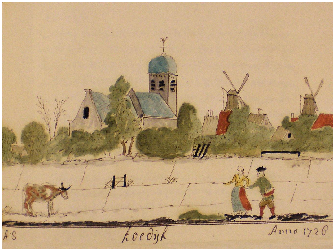
Koedijk in 1726