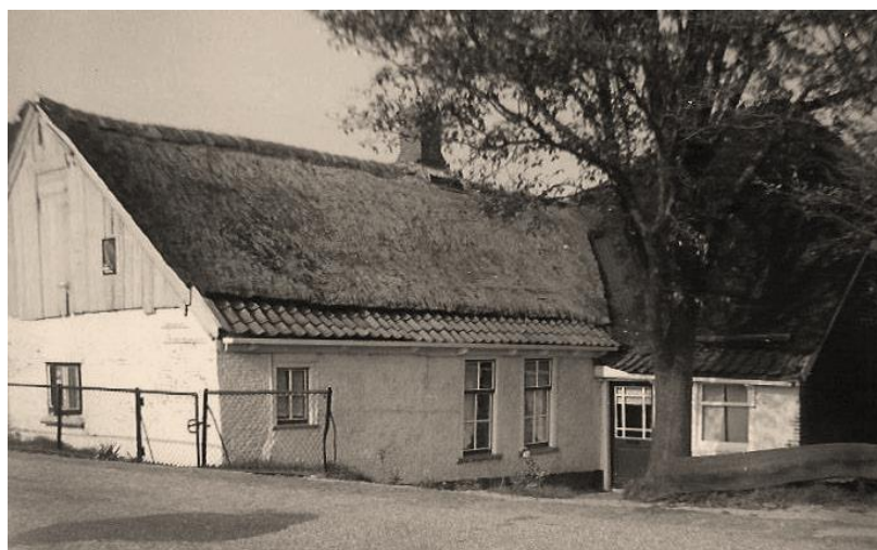
Kanaaldijk 28, brandstoffenhandel Lugtigheid