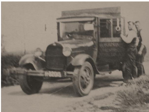
De eerste vrachtauto

-Lijntje, geboren 02-03-1910 te Alkmaar, bleef ongehuwd