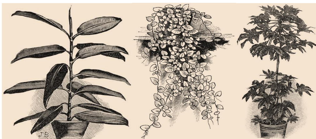
Ficus elastica (Rubberplant), Ficus repens (Kruipende ficus) en Aralia of Fatsia (Vingerplant)

Ook waren de ramen van enkel glas en waren de kozijnen ook niet altijd tochtvrij. Planten op de vensterbank konden in de winter dus ook wel eens bevrozen! Het bekende plantentafeltje kon hier uitkomst bieden. Ook waren de ramen in het algemeen kleiner dan tegenwoordig en was het hierdoor minder licht in huis. Geen probleem voor de clivia.