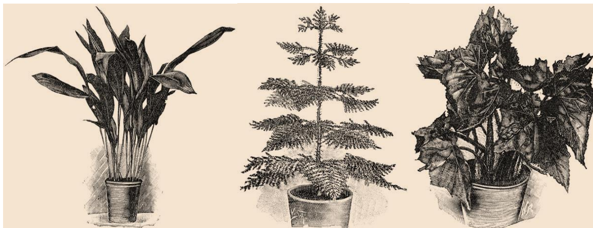
Aspidistra (Blarenplant), Araucaria (Kamerden) en Begonia rex (Bladbegonia)

Natuurlijk werden er vroeger ook nog andere planten in de kamer gehouden. Hierbij dient men er echter wel rekening mee te houden dat er vaak maar één kachel in één kamer was en dat de rest van het huis dus min of meer afhankelijk was van de buitentemperatuur.