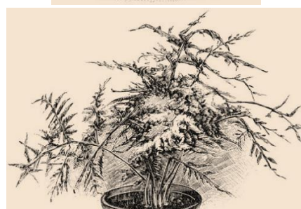
Sinningia (Gloxinia), Primula (Sleutelbloem) en Asparagus (Sierasperge)

Natuurlijk is dit lijstje niet volledig. Ik mis bijvoorbeeld al de cycлаam en de bloeiende begonia, die altijd een mooi verjaardagscadeau waren. Maar onze ouders, grootouders en zelfs overgrootouders zaaiden en stekten ook nog heel wat andere soorten kamer-, balkon- en tuinplanten om het gezellig in huis te maken.