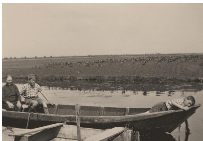
Dick in het schuitje

kwamen we bij de veiling aan. We gingen eerst een sneetje brood in dat café bij de veiling eten, daarna gingen we lossen, we losten in een Hunzeboot, die in een kanaal daar bij Langedijk lag. Het was voor de weermacht, hij moest naar Emden. Maar om in dat kanaal te komen moesten we door een sluis en die schutte om het uur, dus moesten we tot 10 uur wachten om ongeveer 11 uur was al de kool gelost en om 12 uur mochten we weer door de sluis. Toen gingen we ons verdere brood op eten. Om een uur of één gingen we naar huis waar we ongeveer kwart over