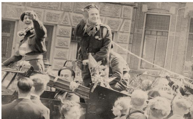
Canadese soldaten in 1945