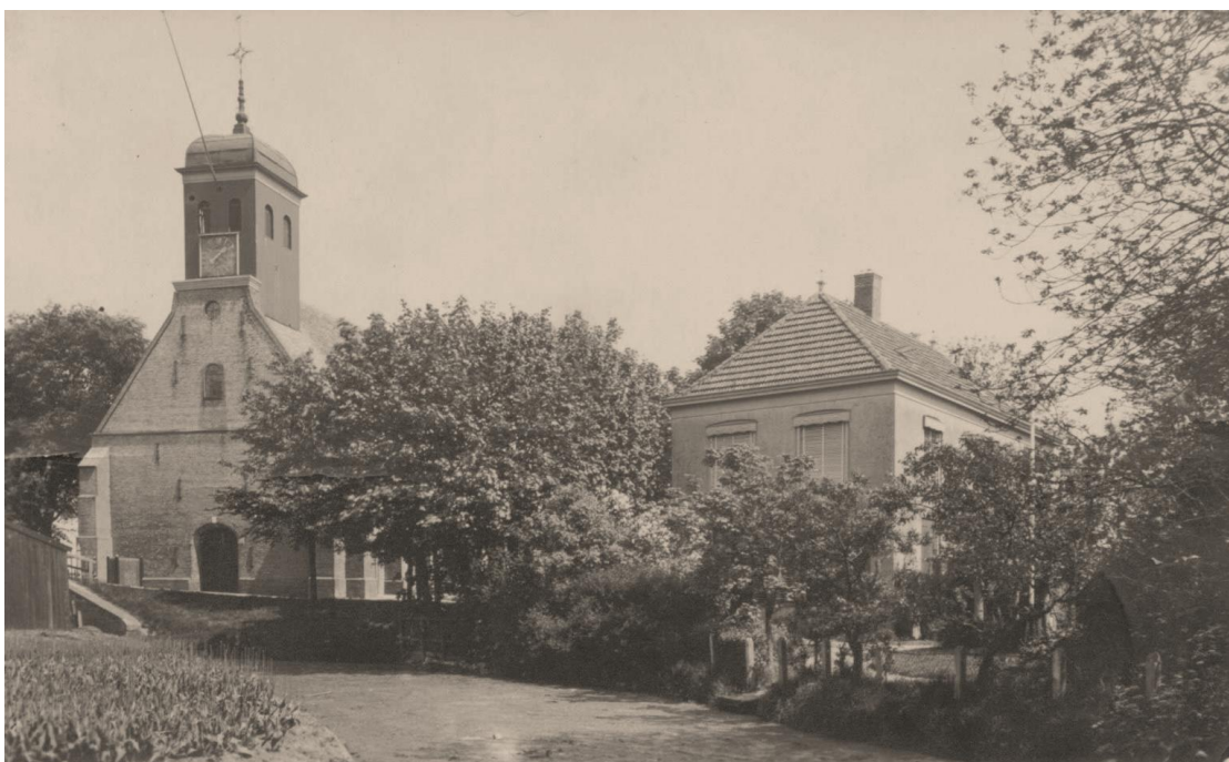
Kerk en pastorie in Koedijk

Het was mijn bedoeling U hedenmiddag per auto een bezoek te brengen. Maar de auto van de verhuurder is stuk. En daarom richt ik mij schriftelijk tot U.