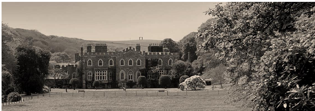
Hartland Abbey (Engeland)