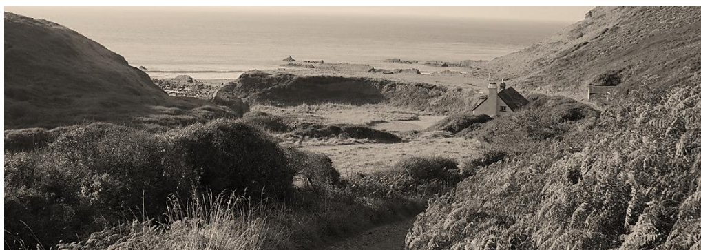
De kust bij Hartland (Engeland)

Kort samengevat: geen enkele aanwijzing dat de familie Hartland daar vandaan kwam noch uit de plaatsen met die naam in Canada en de U.S.A. en ook geen familiewapen maar dat laatste kan alsnog gemaakt worden door degene die daar de knip voor wil trekken.