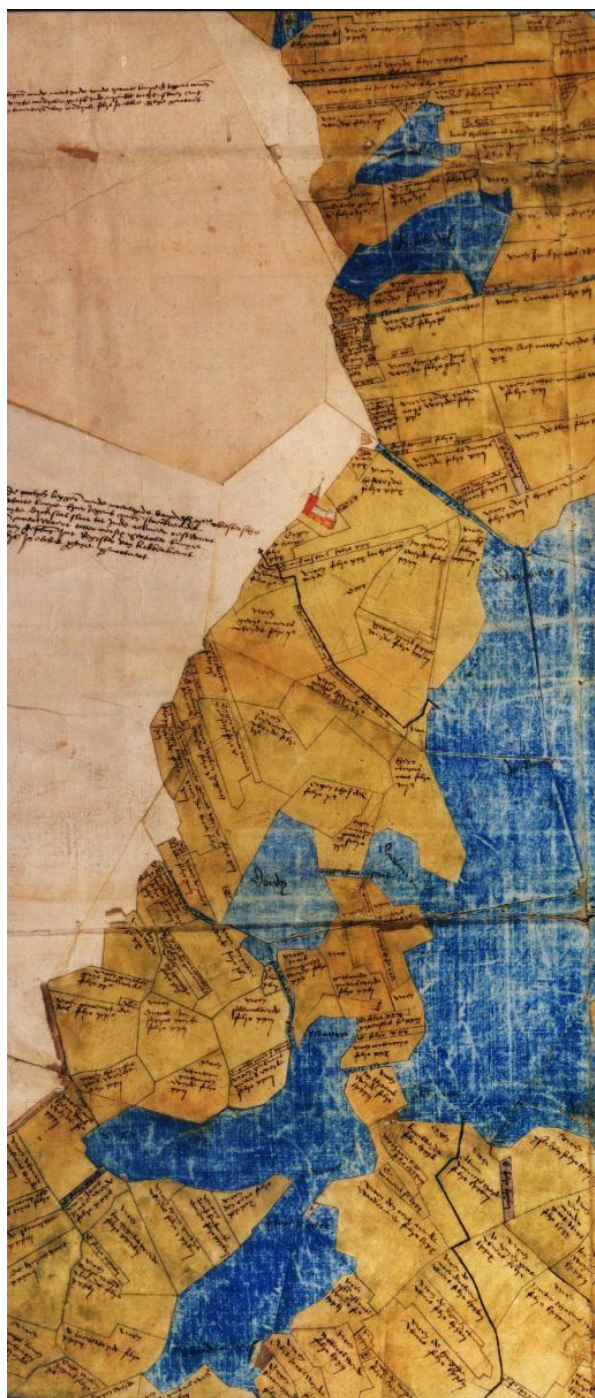
Gedeelte kaart uit 1530 met de kerk van Koedijk

Up II e artikel seyt de voors. vicecureyt [=onderpastoor], datter zijn omtrent 580 communicanten. Up III e artikel seggen, dat zy geenrehande exchijsen [= accijnzen] en hebben, maer zijn de voors. van Coedijck belast mit 73 Rh. gl [= Rijnsch gulden]. tsjaers lijfrenten, daarvan datter 22 zijn up 3 lijven, 13 up 1 lijf, ende alle dander up 2 lijven, welke voorn. renten vercoft [= verkocht] zijn geweest binnen 6 jaeren herwaerts [=terug], ende de hooftpenninghen daarvan gecommen zijn geemploijeert [= aangewend zijn] geweest in mijns genadichs heeren beden ende oncosten van den lande ende oorloge van Gelre; ende by compositie [= schikking] by hemluyden gemaict mitten baillu van der Nyenborch, zoo moeten zy hem betailen 36 Rh. gl. tsjaers, 8 jaeren lanck geduerende, dies zijnder 2 jaeren verlopen ende betailt, ende dat in recompense [= vergoeding] dat de voorn. heml. gelaten heeft tschoutambocht aldaer, dat in zijnen pachte was, ende voort om andere vrientscip, die hy den dorpe doen mach.