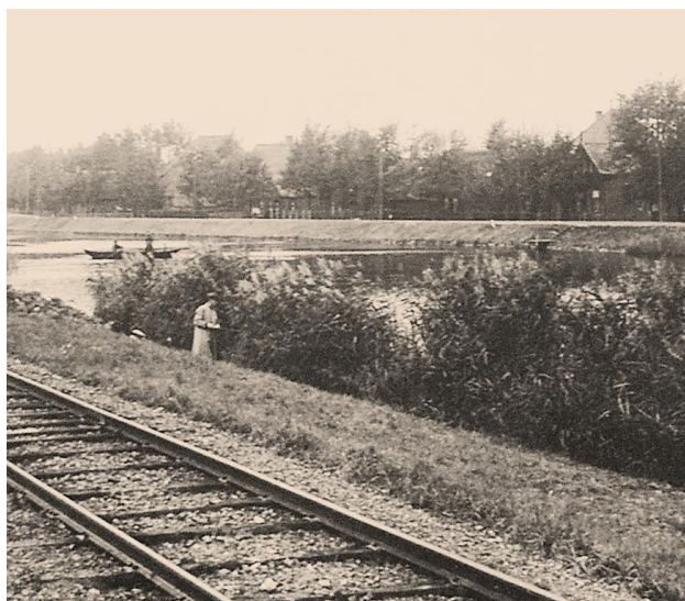
Overzetveer bij halte Koedijk-Noordeinde

Een stukje verder stond een bordje met de tekst: "Overzet, groot 5 cent, klein 2 ½ cent". Vlak daarnaast stond een paaltje met een bel. Uiteraard mochten de kinderen de bel luiden. Dit was het teken voor de winkelier/kastelein, die aan de overkant woonde, dat er mensen met de veer overgezet wilden worden. Hij voer dan met de roeiboot naar de overkant van het kanaal en haalde zijn klanten op. Gelukkig hoorde hij de bel en kwam er spoedig aan met zijn bootje.