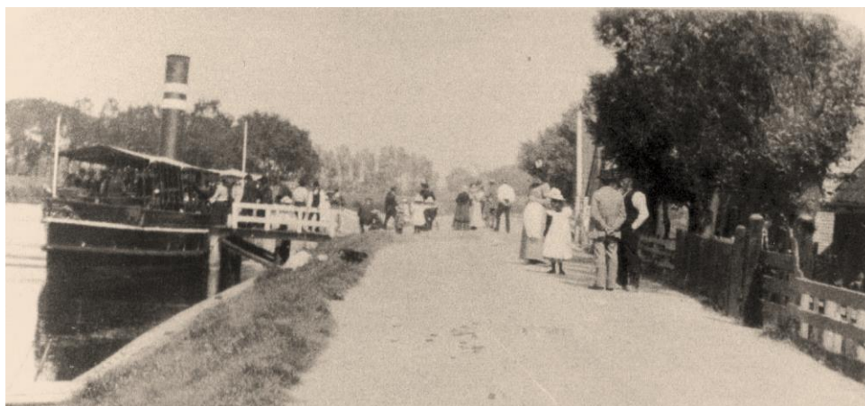
Zuidelijke aanlegsteiger in Koedijk

De postwagen tussen 't Zand en Den Helder vertrekt vanuit 't Zand zodra de trekschuit uit Alkmaar is aangekomen en vanuit Den Helder elke morgen "tegen de middag".