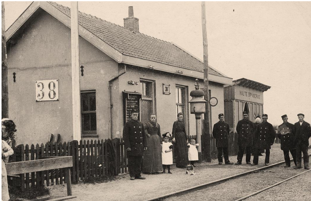
Halte Sint Pancras/gemeente Koedijk

Daarnaast was er ook de stoomtrein. Tussen Alkmaar en Den Helder was een spoorlijn aangelegd (klaar in 1865) en daarover werd een lijndienst onderhouden door de Hollandsche IJzeren Spoorweg-Maatschappij.