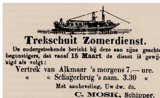
Advertentie uit 1869

De reis van Alkmaar naar Den Helder ging in 1820 per trekschuit en postwagen en duurde lang. Met de trekschuit vertrok men vanuit Alkmaar - van Alkmaar naar Koedijk voer men in \frac{3}{4} uur - vervolgens van Koedijk naar Schoorldam in 1 uur - dan van Schoorldam naar Krabbendam in \frac{1}{2} uur - van Krabbendam naar Burgerbrug in \frac{1}{2} uur - van Burgerbrug naar St. Maartensbrug in 1 uur - van St. Maartensbrug naar Schagerbrug in \frac{3}{4} uur - van Schagerbrug naar Keinsmerbrug in \frac{1}{2} uur - tenslotte van Keinsmerbrug naar 't Zand in \frac{3}{4} uur In 't Zand stapte men over op de postwagen en reed in 2 uur naar Den Helder. - van 't Zand naar Groote Keeten