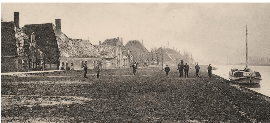
De trekschuit bij de Kerkelaan in Koedijk

Ter gelegenheid van het 50-jarig bestaan van de Hollandsche IJzeren Spoorweg-Maatschappij werd in 1885 een Gedenkboek uitgegeven. Hierin werd onder andere aandacht besteed aan de vooruitgang van het openbaar vervoer in Nederland in het algemeen.