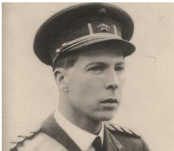
Prins Karel van België

En verder ging de reis door Alkmaar, langs het Alkmaarder meer en door de Zaanstreek op weg naar Amsterdam.