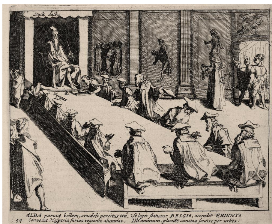
Alva zit de Raad van Beroerten voor

Enige gevolgen van de opkomst van het protestantisme waren godsdienstige beroering, hagepreken en de Beeldenstorm. Deze opstand van overtuigde calvinisten begon op 10 augustus 1566 te Steenvoorde in de Zuidelijke Nederlanden, het huidige België, breidde zich uit over de gehele