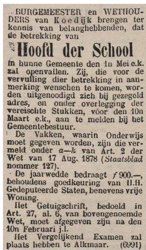
Advertentie uit Het Nieuws van den Dag d.d. 25 febr. 1886

Bij de raadsvergadering van 4 mei wordt een en ander besproken. Een commissie heeft zoveel mogelijk persoonlijke informatie ingewonnen en brengt hiervan verslag uit.