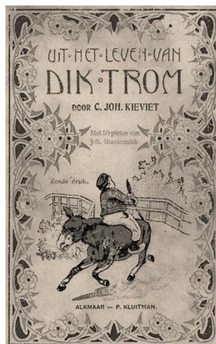
Uit het leven van Dik Trom

In 1891 verscheen zijn eerste boek "Uit het leven van Dik Trom" bij uitgeverij Kluitman. Dit boek werd door hem dus in Etersheim geschreven. Aanvankelijk liep de verkoop van het boek niet zo goed, pas bij uitgave van de tweede druk in 1899, toen het boek ook was voorzien van plaatjes kwam de verkoop goed op gang. In 1907 publiceerde hij een vervolgboek "De zoon van Dik Trom", nu dus geschreven in Zaandam. Daarna zouden nog 3 delen volgen in deze serie.