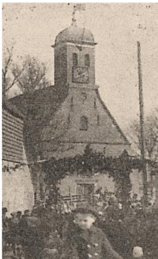
Feest in de Kerkelaan

Het feest eindigde die dag met het afsteken van vuurwerk.