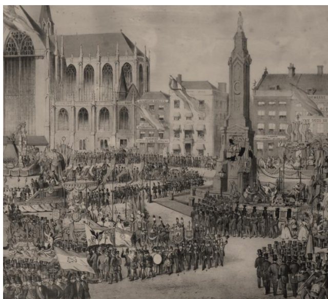
Feest in Amsterdam

's Middags gingen we dan naar de orgelbespeling in de kerk, waar de organist een heele rits volksliederen in allerlei toonaarden tokkelde en dan fantasieën daar op en dan ook nog oud-